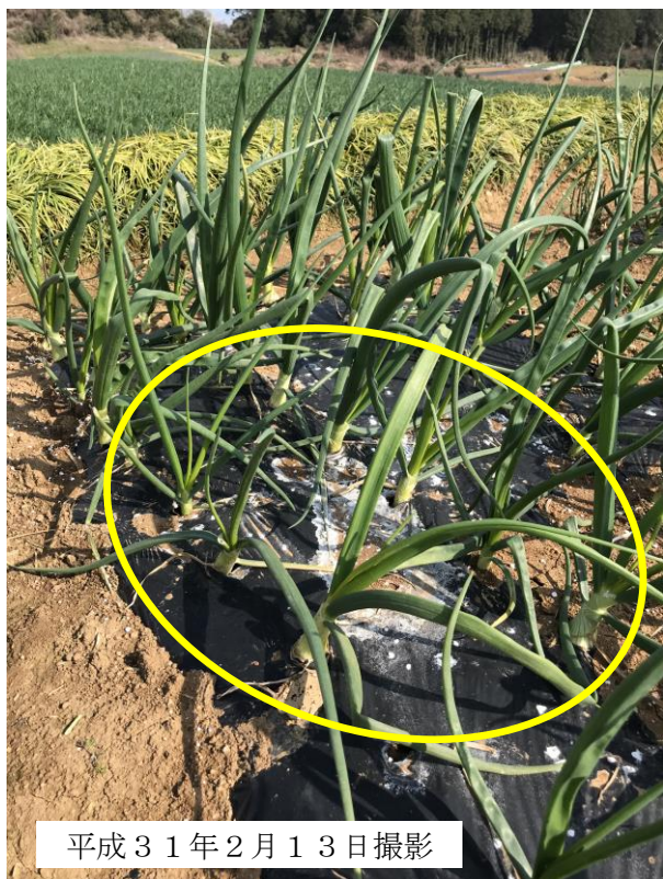
写真1 越年罹病株（葉がやや黄化して外に湾曲）

(4) 薬剤耐性発達防止のため、同一系統の薬剤を連用しない（平成30年長崎県病害虫防除基準P260～261の「作用機構による分類（FRAC）」参照）。