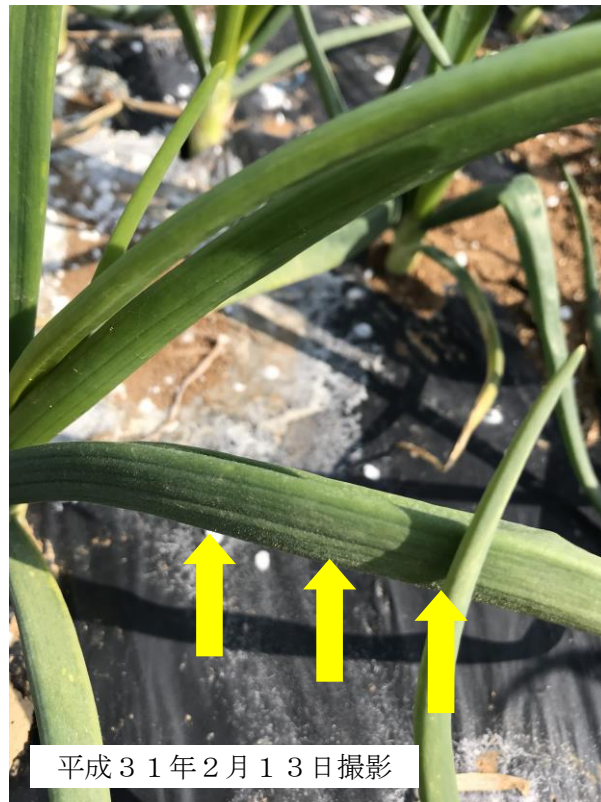
写真2 葉身上に形成された分生孢子