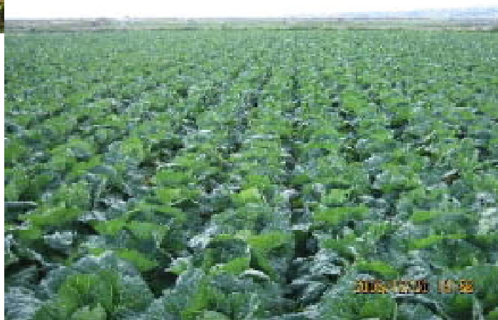
(キャベツの生育状況)