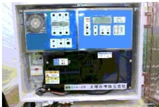
写真4 メインユニット

省力化のため、かん水同時施肥システムを導入しています。写真4がかん水量や時間、肥料濃度を設定するメインユニット。写真5は肥料を一定濃度に希釈しておくタンク。写真6はかん水量にあわせ設定した濃度になるよう、液肥混入定量ポンプです。かん水チューブは点滴用のラムチューブを使っています。