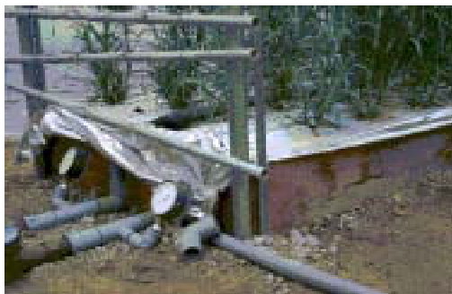
写真2 木枠の隔離床