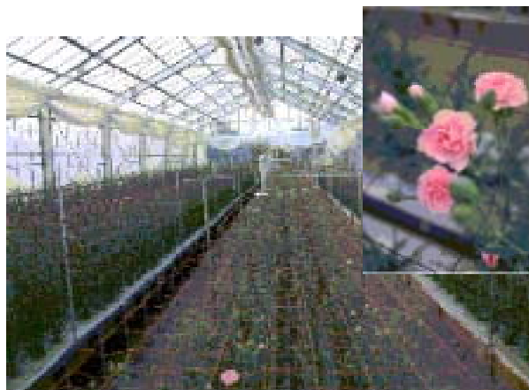
収穫直前のカーネーションの様子 右上:ライトピンクバーバラ

施肥は、かん水同時施肥による追肥のみで、気温が高い時期は、かん水量を多く肥料濃度を下げて、気温が低い時期はかん水量を抑えて肥料濃度を高くするなどかん水量と施肥量のバランスをとりながら、各月毎に設定を変えて行っています。収穫は平成17年は10月下旬から翌年5月