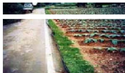
耕土流出を防止するグリーンベルト