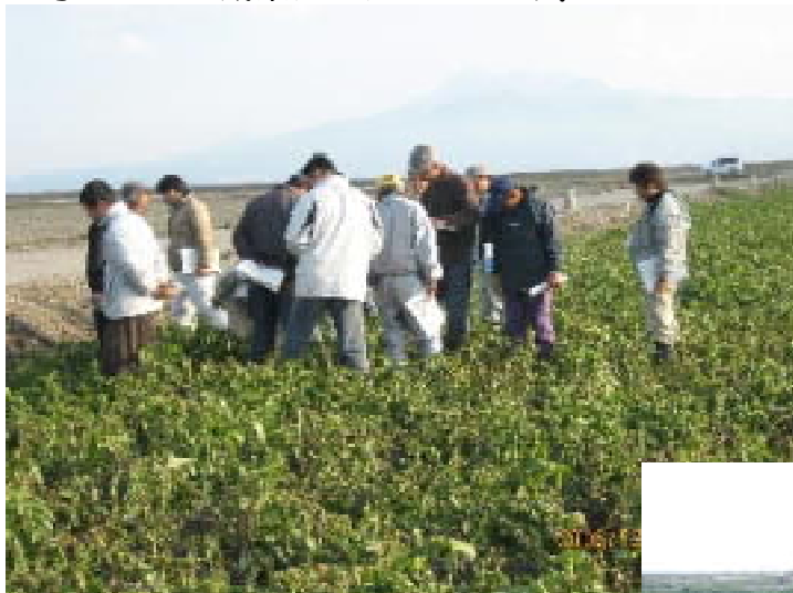
(収穫間近の秋ばれいしょ)

18年度営農実証試験の第1回目の現地検討会が、実証農業者の皆さんと関係機関の参加のもと、12月20日に開催されました。昨年は9月の台風13号の襲来や、その後の干ばつ等必ずしも天候に恵まれたとはいえませんでした。既に収穫を終えた秋ばれいしょ、ブロッコリー等は上々の成果が上がっています。