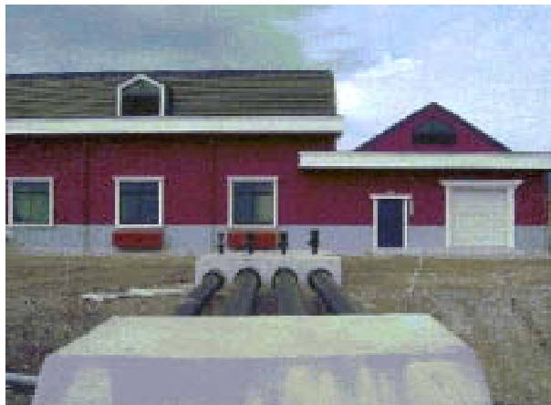
中央揚水機場からほ場へ送水する用水路