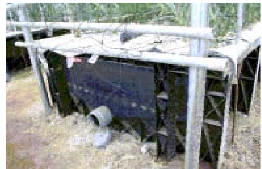
写真3 くみあいスーパードレインベット