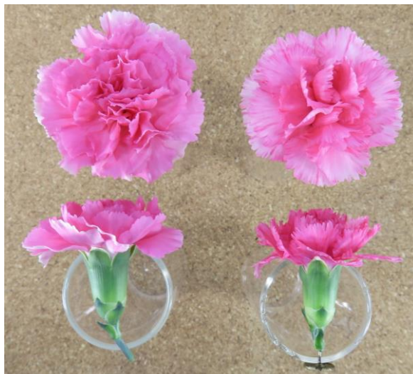
「ももかれん」 「ダークピンクバーバラ」