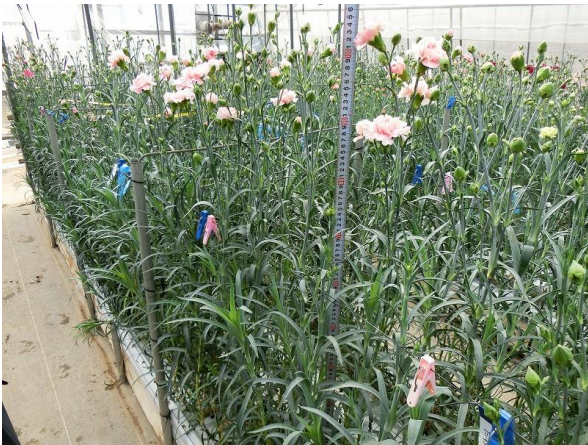
写真 1 栽培区全景 撮影日：2018年3月7日