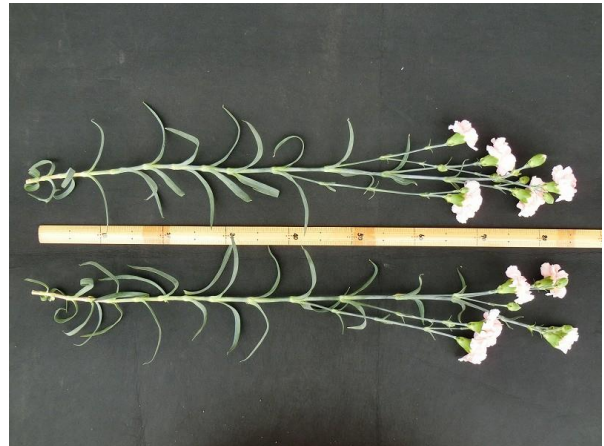
写真 2 植物体全体 撮影日：2018年3月9日