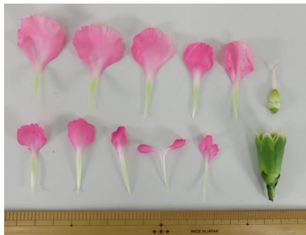
写真10 花分解 撮影日: 2018年3月6日