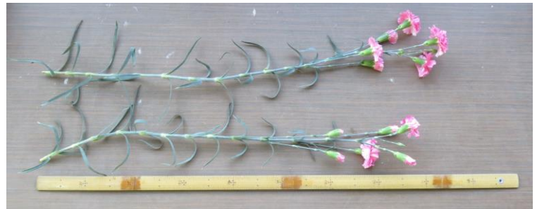
写真8 植物体全体 撮影日: 2018年3月6日