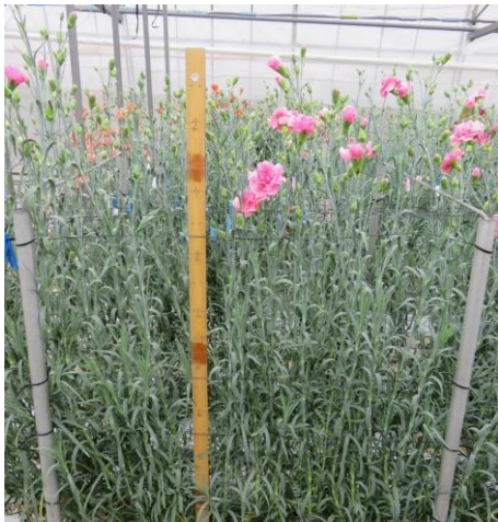
写真7 栽培区全景 撮影日: 2018年3月20日