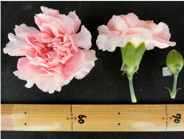
写真 3 花色・花型 撮影日：2018年3月9日