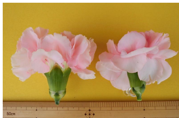
「ほほえみ」 「だいすき」