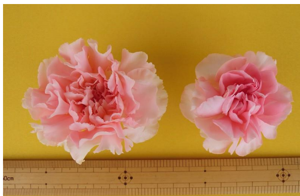
「ほほえみ」 「だいすき」