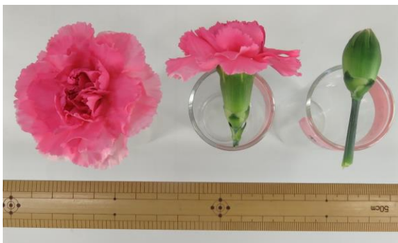
写真9 花色・花型 撮影日: 2018年3月6日