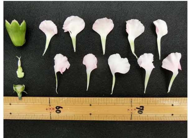
写真 4 花分解 撮影日：2018年3月9日