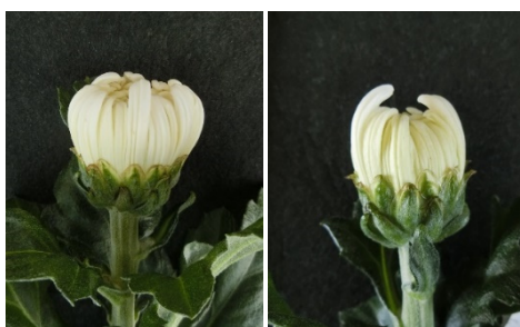
写真1 頭花の形状 (左：慣行区，右：22 - 10 区)

y a式において算出した各処理区の暖房負荷(kw)について、慣行の暖房を100とした時の削減率