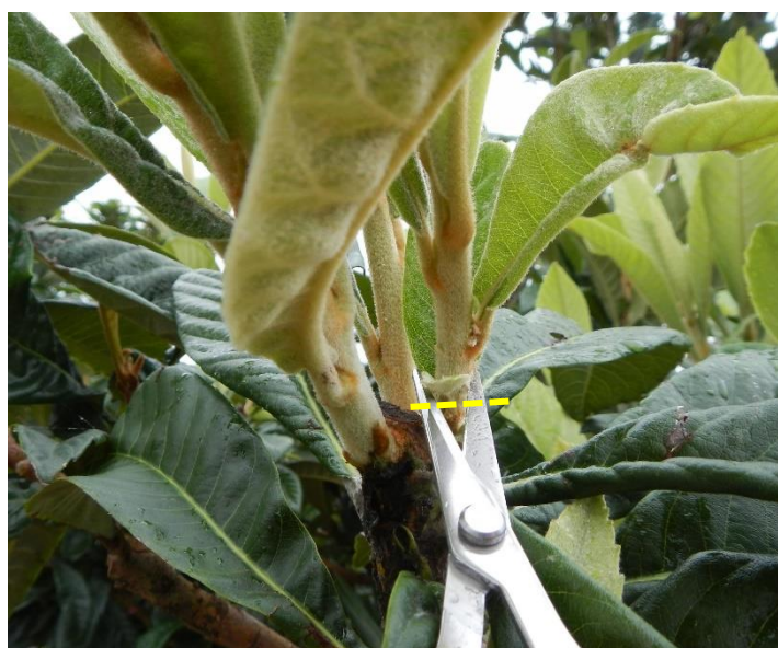
写真1 果こん枝2枝を残す芽かき方法（点線部で切除）