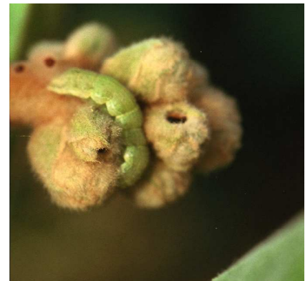
図3 オオタバコガ幼虫