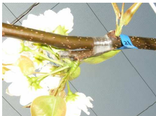
図1 花芽接ぎにより開花した穂木