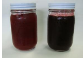
写真2 スモモ「ハリウッド」ジャム (左：満開106日後果実、右：満開119日後果実)