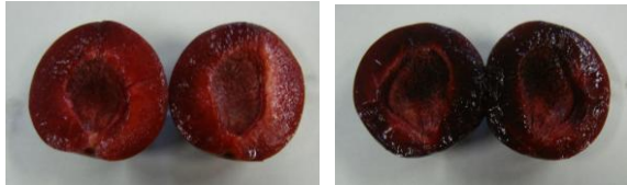
写真1 スモモ「ハリウッド」 (左：満開106日後果実、右：満開119日後果実)