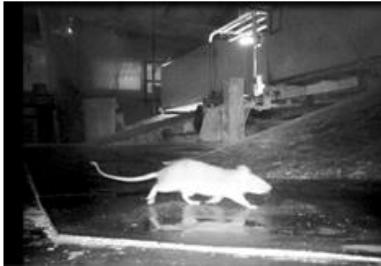
図1 トレイルカメラで撮影された豚舎内に生息するクマネズミ