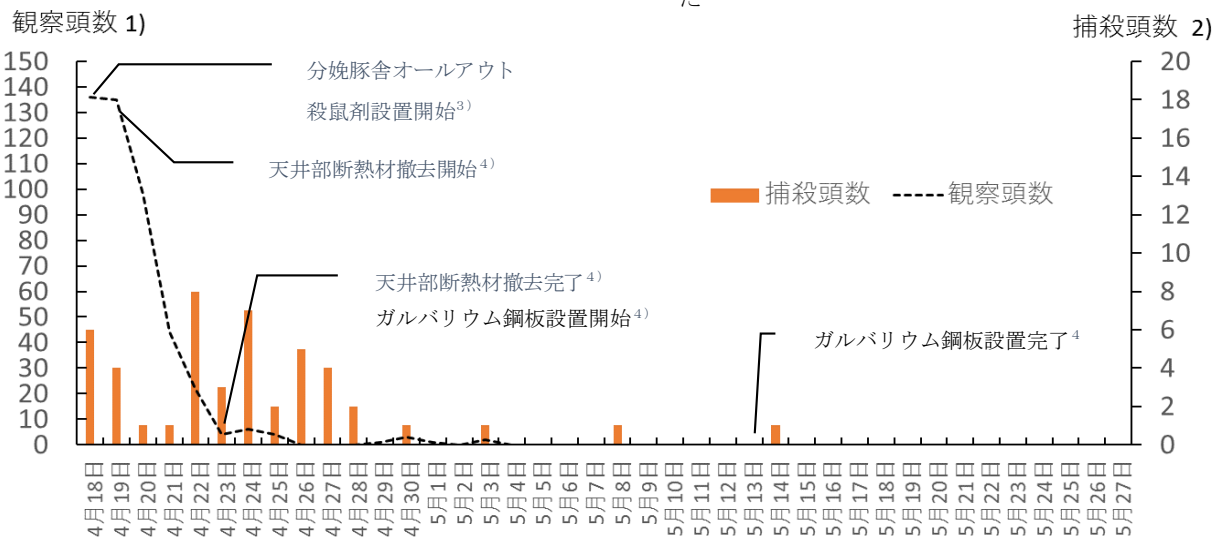
図3 繁殖豚舎でのネズミの観測頭数と捕殺頭数の推移