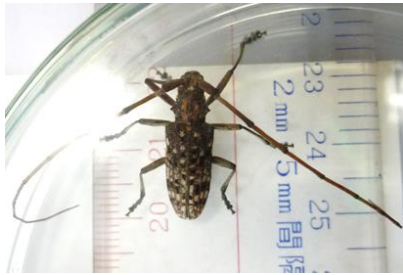
写真1 マツノマダラカミキリ成虫