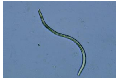
写真2 マツノザイセンチュウ