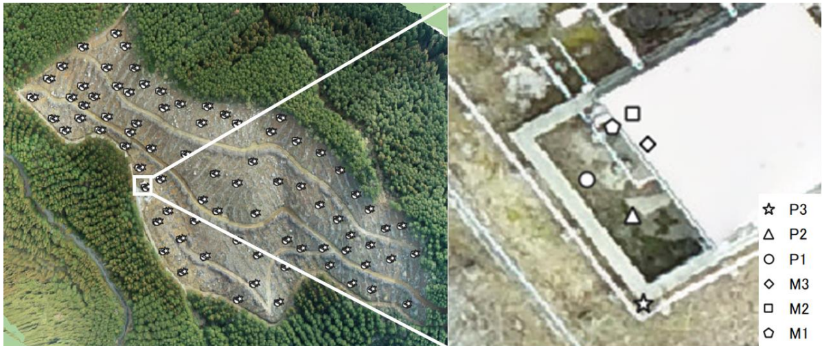
図 1 試験区のオルソ画像 (P3のもの) と標定点の位置 (左)、拡大図 (右)

注 : P : PHANTOM4RTK、M : MAVIC2PRO、1 : 12/18、2 : 1/14、3 : 1/21 を示す