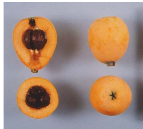
図3 「ピワ長崎15号」の果実