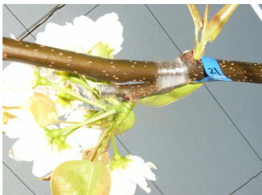
図1 花芽接ぎにより開花した穂木