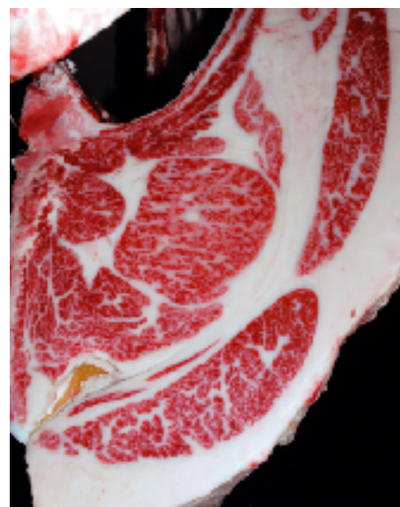
母の父/平茂勝 BMS. No. 10 母の祖父/康福3 ロース芯 64cm 2