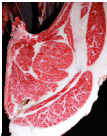
母の父/平茂勝 BMS. No. 11 母の祖父/康福3 ロース芯 74cm 2