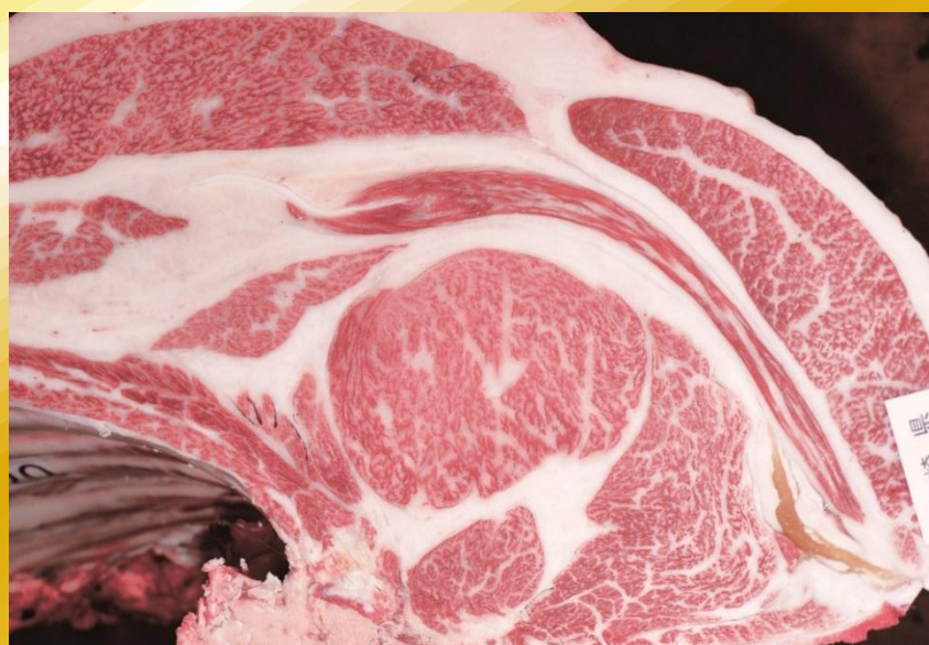
勝乃幸-平茂晴-平茂勝 BMS No.12 ロース芯 67cm 2 枝肉重量 536.0kg