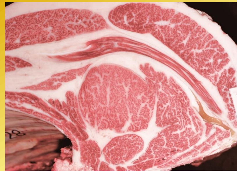
勝乃幸-安福久-平茂勝 BMS No.12 ロース芯 66cm 2 枝肉重量 486.0kg