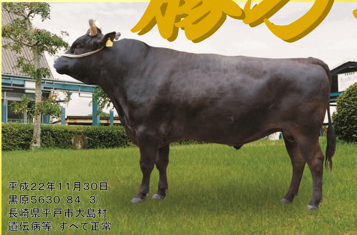
平成22年11月30日 黒原5630(84.3) 長崎県平戸市大島村 遺伝病等:すべて正常