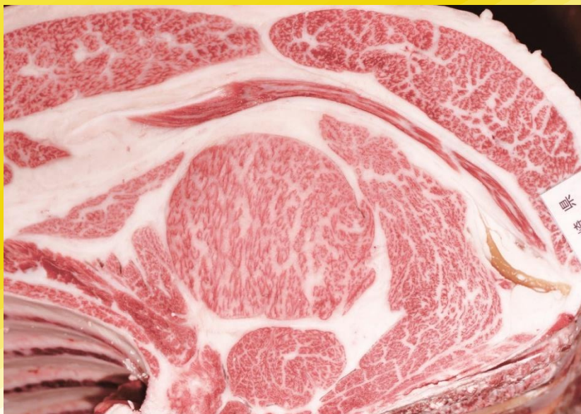
勝乃幸-平茂晴-川 幸 BMS No.12 ロース芯 83cm 2 枝肉重量 539.0kg

「勝乃幸」は、長崎県が誇る気高系種雄牛「勝乃勝」と、脂肪交雑育種価が特に高い「ゆきこ」との組み合わせにより造成された気高系種雄牛です。現場後代検定では、平均BMS.No. 9.9(去勢10.3)、4・5等級率100%と日本一の成績を収めました。今後、肉質・肉量の改良を目的とした種雄牛として、本県肉用牛の改良に貢献することが期待されます。