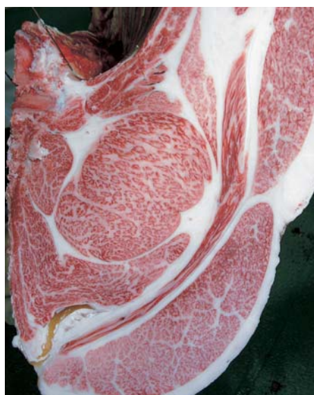
母の父/安福久 BMS. No. 12 母の祖父/平茂勝 ロース芯 93cm 2