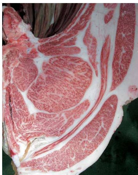
母の父/平茂晴 BMS. No. 11 母の祖父/牛若丸 ロース芯 84cm 2