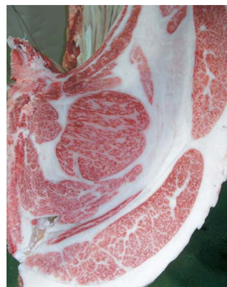
母の父/平茂晴 BMS. No. 10 母の祖父/松寿丸 ロース芯 75cm 2