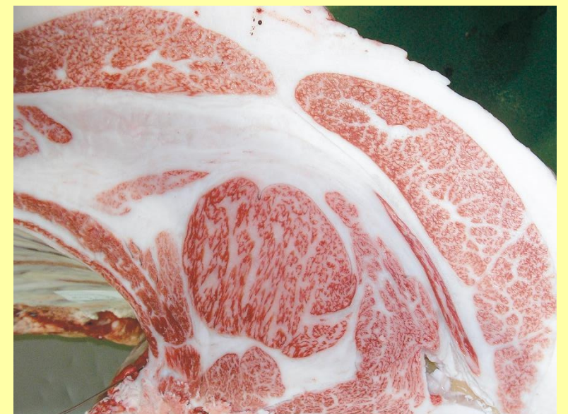
百合幸-平茂晴-松寿丸 BMS No.10 ロース芯 75cm 2 枝肉重量 518.5kg