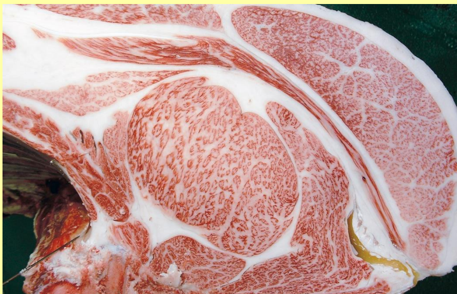
百合幸-安福久-平茂勝 BMS No.12 ロース芯 93cm 2 枝肉重量 578.2kg

今後、肉質・肉量の改良を目的とした種雄牛として、本県肉用牛の改良に貢献することが期待されます。