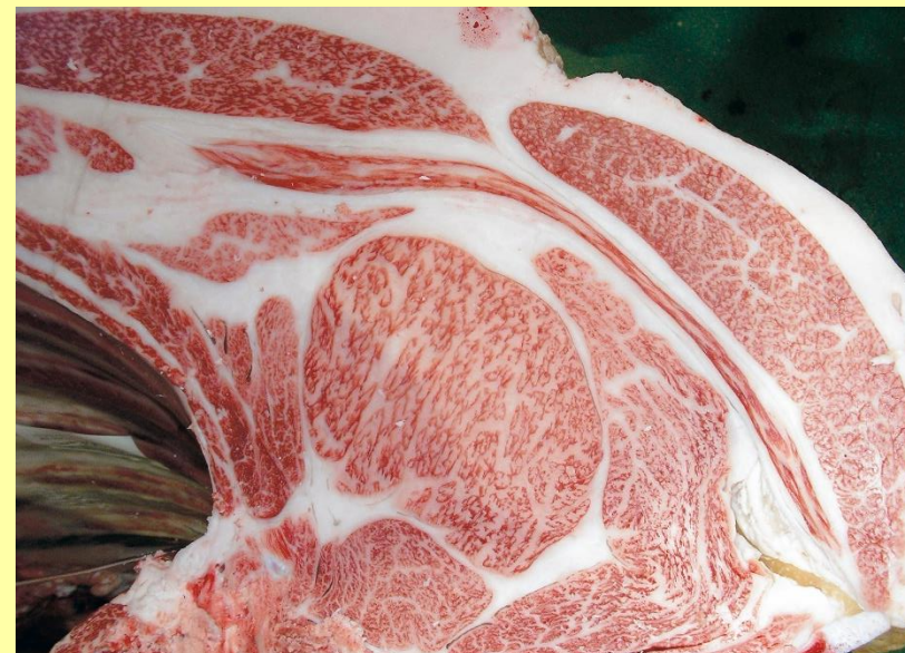
百合幸-平茂晴-牛若丸 BMS No.11 ロース芯 84cm 2 枝肉重量 609.7kg