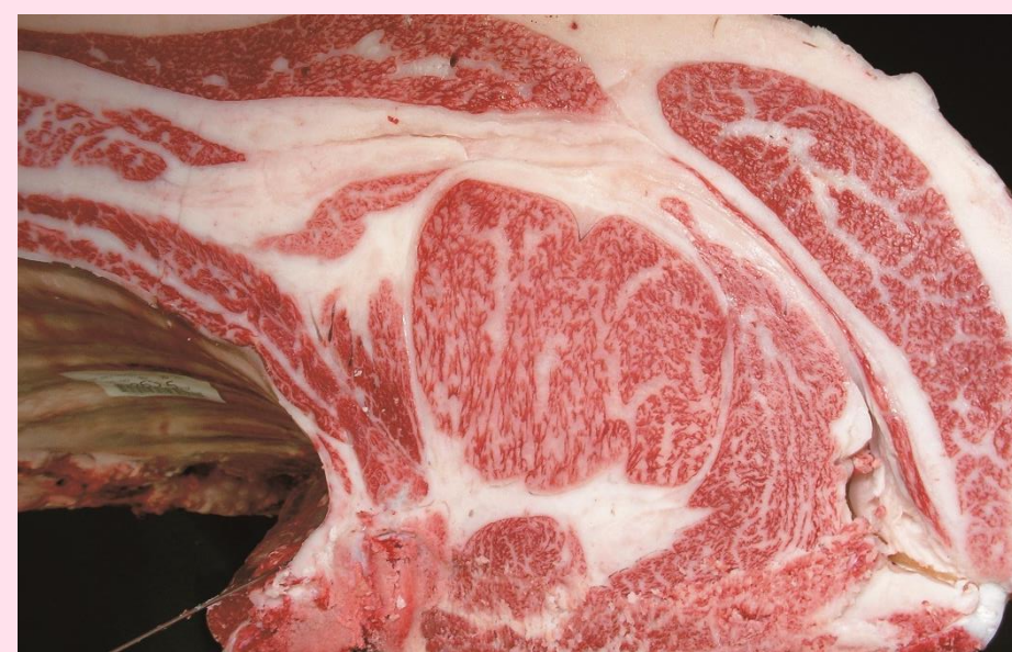
弁慶3-平茂晴-安平 BMS No.10 ロース芯 76cm 2 枝肉重量 527.8kg