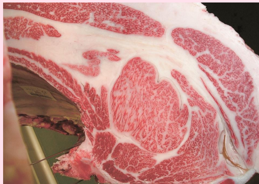
弁慶3-平茂晴-福栄 BMS No.11 ロース芯 77cm 2 枝肉重量 565.2kg