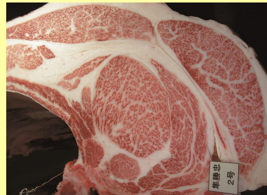
隼勝忠-安福久-平茂勝 BMS No.11 ロース芯 90cm 2