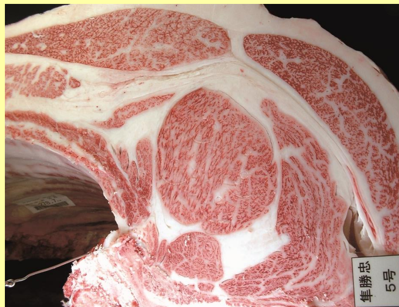
隼勝忠-平茂晴-金幸 BMS No.12 ロース芯 82cm 2