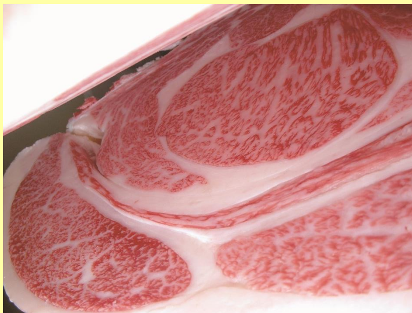
隼勝忠-第5隼福-平茂勝 BMS No.12 ロース芯 71cm 2

今後、肉質・肉量の改良を目的とした種雄牛として、本県肉用牛の改良に貢献することが期待されます。