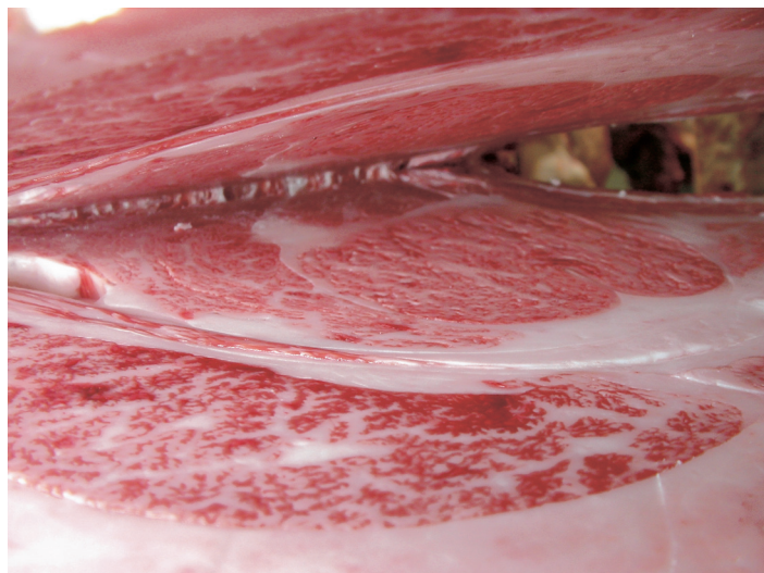
母の父/勝忠平 BMS. No. 11 母の祖父/平茂勝 ロース芯 71cm 2