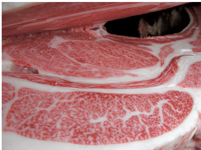
母の父/平茂晴 BMS. No. 11 母の祖父/百合茂 ロース芯 70cm 2