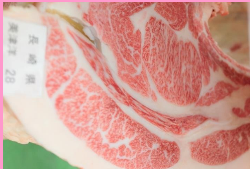
美津洋-平茂勝-安平 BMS No.12 ロース芯 65cm 2 枝肉重量 525.7kg