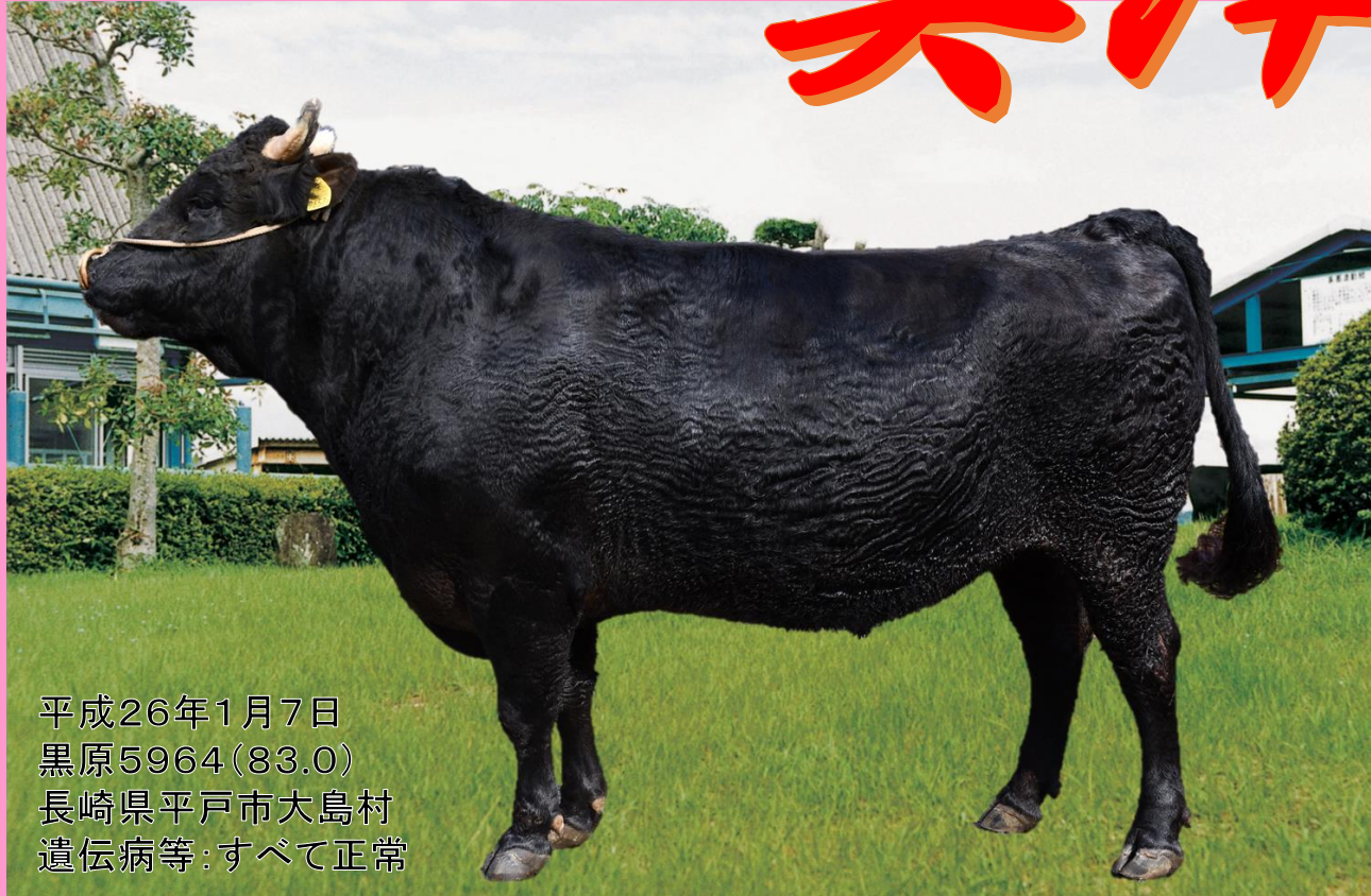
平成26年1月7日 黒原5964(83.0) 長崎県平戸市大島村 遺伝病等:すべて正常