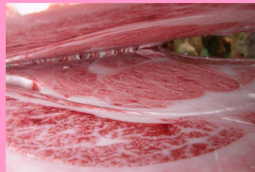
美津洋-勝忠平-平茂勝 BMS No.11 ロース芯 71cm 2 枝肉重量 506.4kg