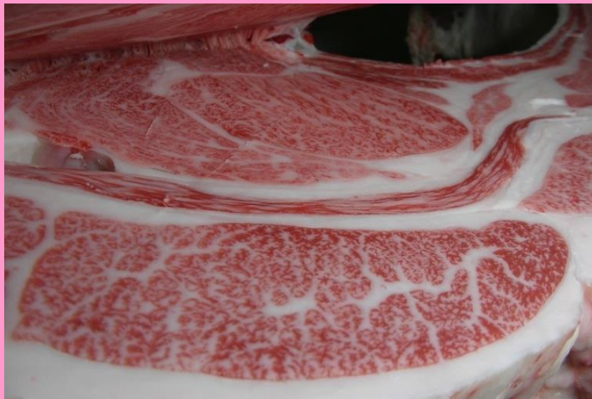
美津洋-平茂晴-百合茂 BMS No.11 ロース芯 70cm 2 枝肉重量 530.6kg

今後、肉質・肉量の改良を目的とした種雄牛として、本県肉用牛の改良に貢献することが期待されます。