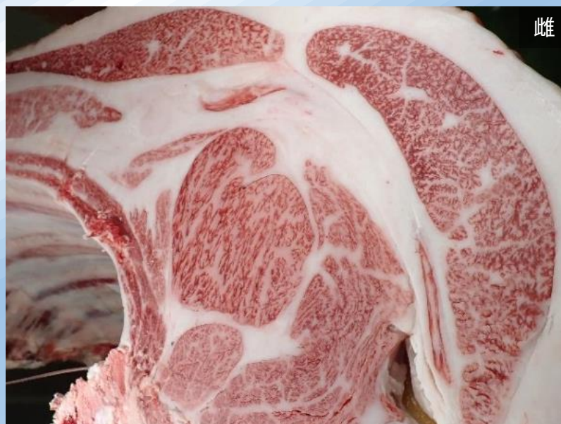
晴太郎-平茂勝-紋次郎 BMS No.11 ロース芯 71 cm 2 枝肉重量 511.5 kg