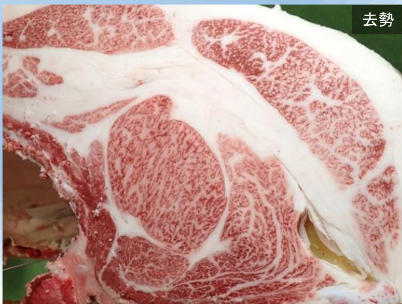
晴太郎-勝忠平-福之国 BMS No.12 ロース芯 80 cm 2 枝肉重量 618.9 kg

今後、「平茂晴」の後を継ぐ糸桜種雄牛として、本県肉用牛の改良に大きく貢献することが期待されます。