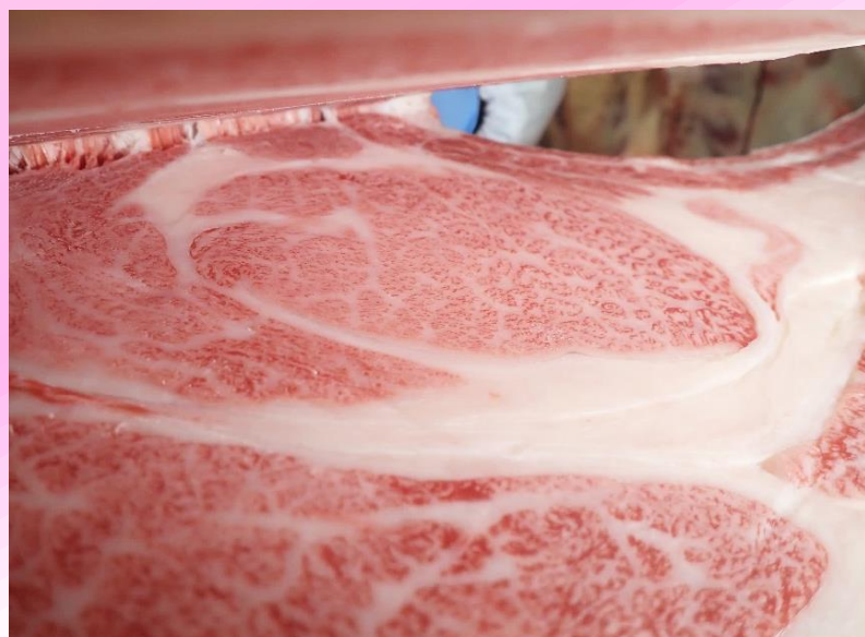
雌 真乃介-平茂晴-平茂勝 BMS No.12 ロース芯 100 cm 2 枝肉重量 513.4 kg

今後、肉質の改良を目的とした但馬系種雄牛として、本県肉用牛の改良に貢献することが期待されます。