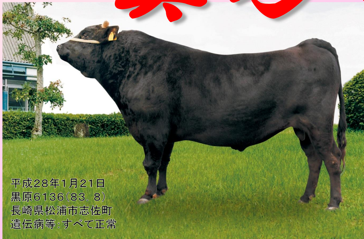
平成28年1月21日 黒原6136(83.8) 長崎県松浦市志佐町 遺伝病等:すべて正常