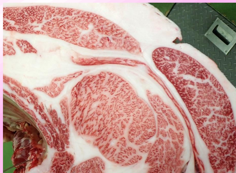
雌 真乃介-平茂晴-忠富士 BMS No.12 ロース芯 84 cm 2 枝肉重量 462.3 kg