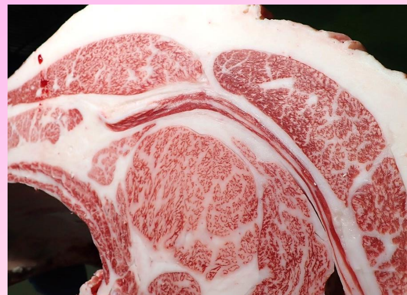
雌 真乃介-金太郎3-安平 BMS No.12 ロース芯 82 cm 2 枝肉重量 479.8 kg