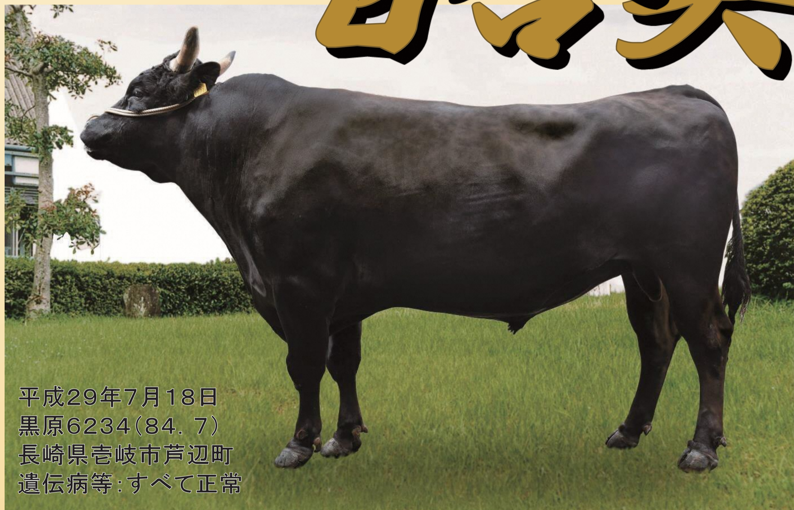
平成29年7月18日 黒原6234(84.7) 長崎県壱岐市芦辺町 遺伝病等:すべて正常