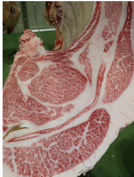
百合英-平茂晴-安平