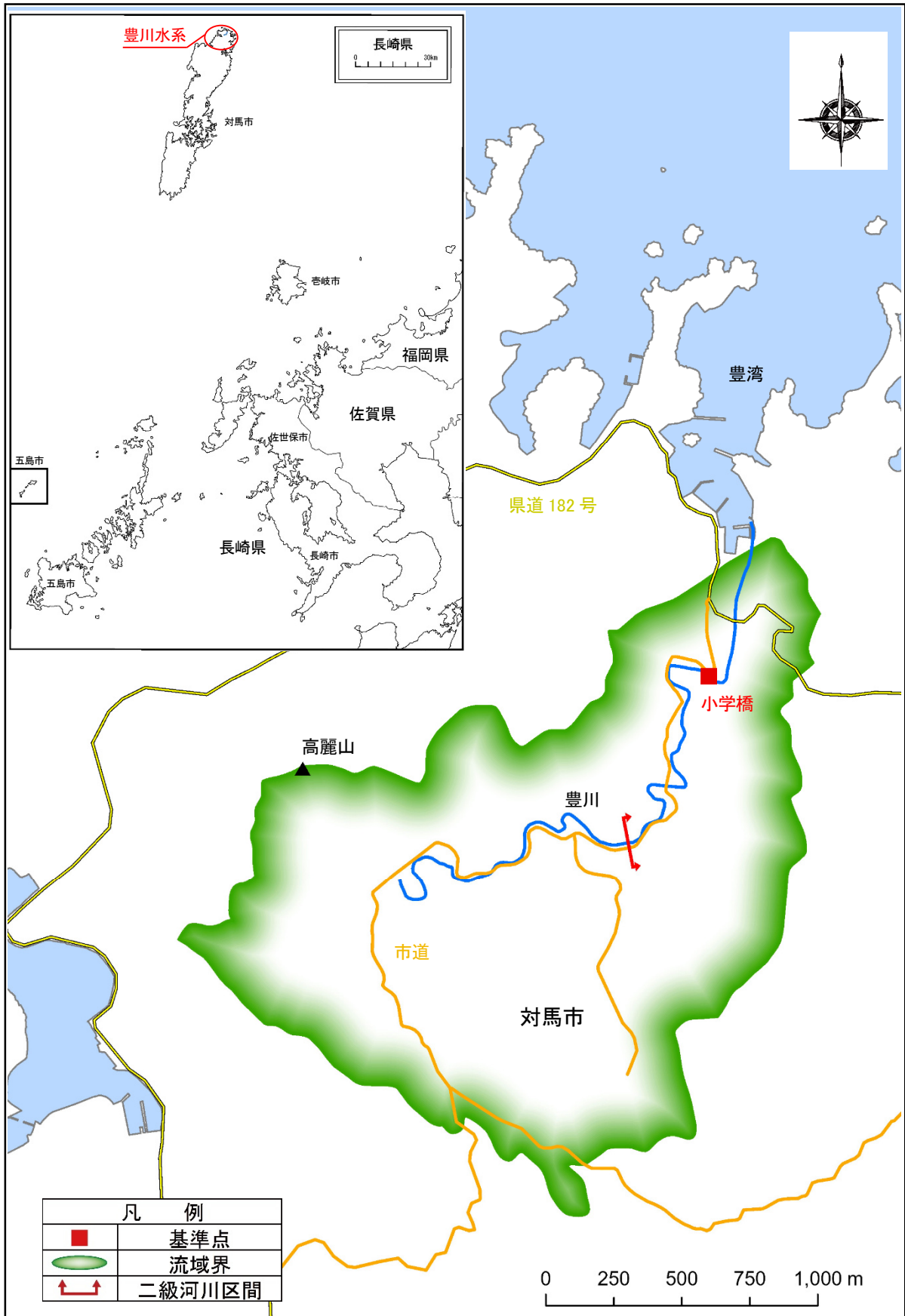
参考図 豊川水系流域概要図