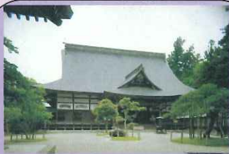
ちゆうそんじほんどう 【中尊寺本堂】

初代清衡が建てたお寺で、中尊寺の中心とされています。ほかにも金色堂とよばれる金色の建物が有名です。