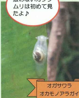
オガサワラ オカモノアラガイ