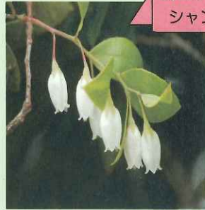
ムニンジャ シャンボ