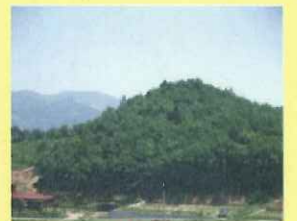
さんけいざん 【金鶏山】