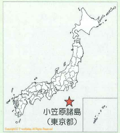
小笠原諸島 (東京都)

小笠原諸島は、東京都から1000キロメートルはなれたところにあり、30あまりの島々からできています。