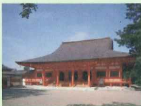
もうつうじ 【毛越寺】

2代基衡が建てたお寺で、お寺以外にも庭や池などいろいろなものが平安時代からほぼ変わらない状態で残っています。