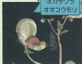
オガサワラ オオコウモリ