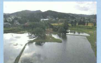
むりょうこういんあと 【無量光院跡】

2代基衡の妻が建てたといわれていて、今は火事によって建物はありませんが公園になっています。