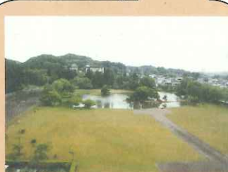
かんじざいおつういんあと 【観自在王院跡】

2代基衡の妻が建てたといわれていて、今は火事によって建物はありませんが公園になっています。