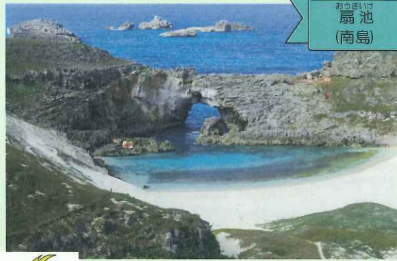
おつさいけ 扇池 (南島)