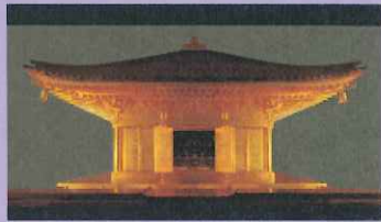
こんじきどう 【金色堂】

初代清衡が建てたお寺で、中尊寺の中心とされています。ほかにも金色堂とよばれる金色の建物が有名です。