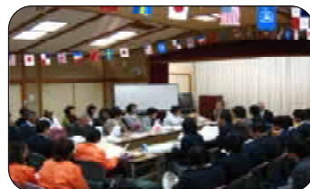
エコ大使サミット

今後は、この活動を継続させていくと共に、学校や地区と協力して、広い範囲へと活動を広げていきたいと考えています。