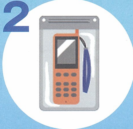
防水パック入り携帯電話 などの適切な 連絡手段の確保