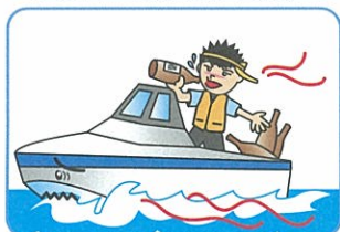
酒酔い等操縦の禁止

ライフジャケットの着用のほか、次のルールに違反しますと、6ヶ月以内の免許停止 等の処分の対象になりますので、注意しましょう！