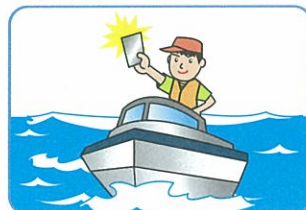
免許者の自己操縦