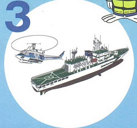
海のもしものは118番

1年間に約300人の方が海難あるいは船舶からの海中転落によって命を落としたり行方不明になったりしていますが、そのうちのおよそ6割が漁船からの犠牲者です。