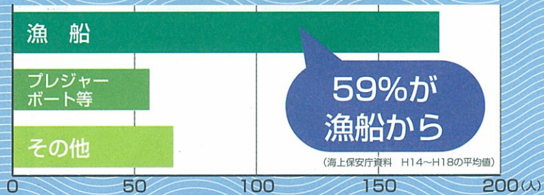
死亡者・行方不明者の発生状況

漁船からの海中転落や海難の際、ライフジャケットの着用により生存率が大幅に向上します。