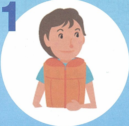
ライフジャケットの 常時着用

大切な命を守るため、そして一人でも多くの方が救助されるよう、次の3つを基本とする「自己救命策確保」を推進しています。