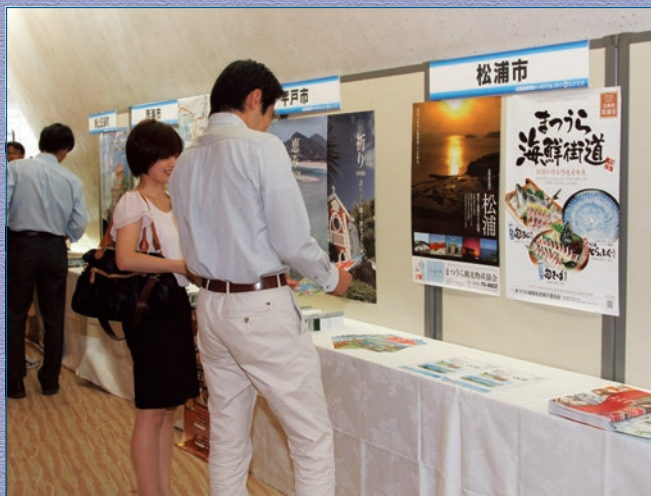
全体会 開催市町紹介コーナー