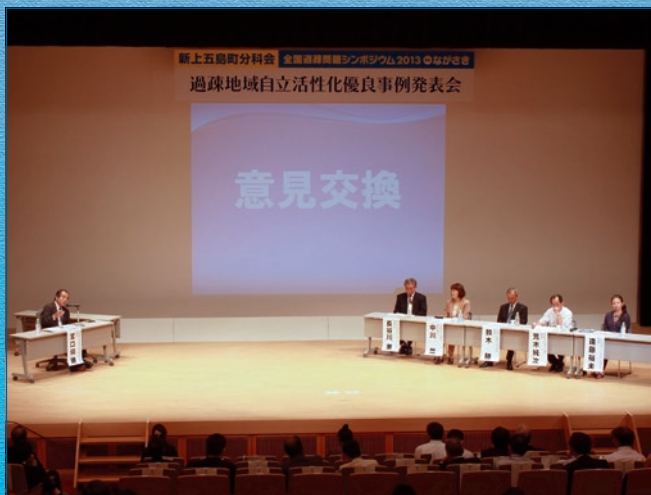
新上五島町分科会