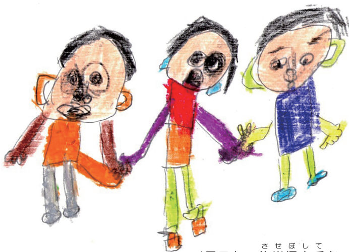
イラスト：佐世保市手をつなぐ育成会 高増和彦さん