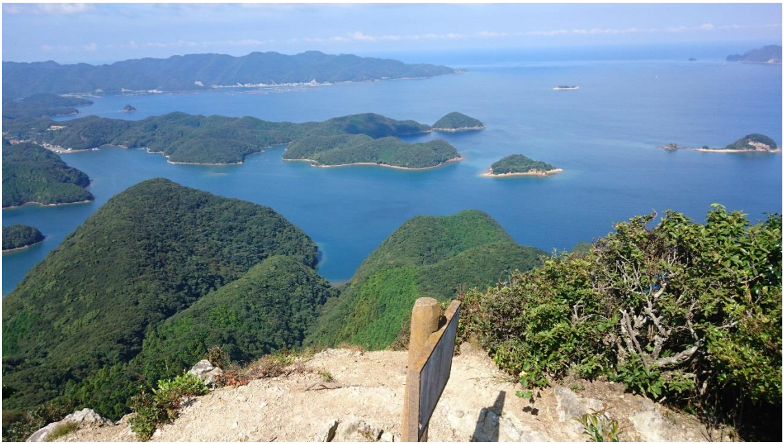
城山（金田城跡）から見下ろす浅茅湾