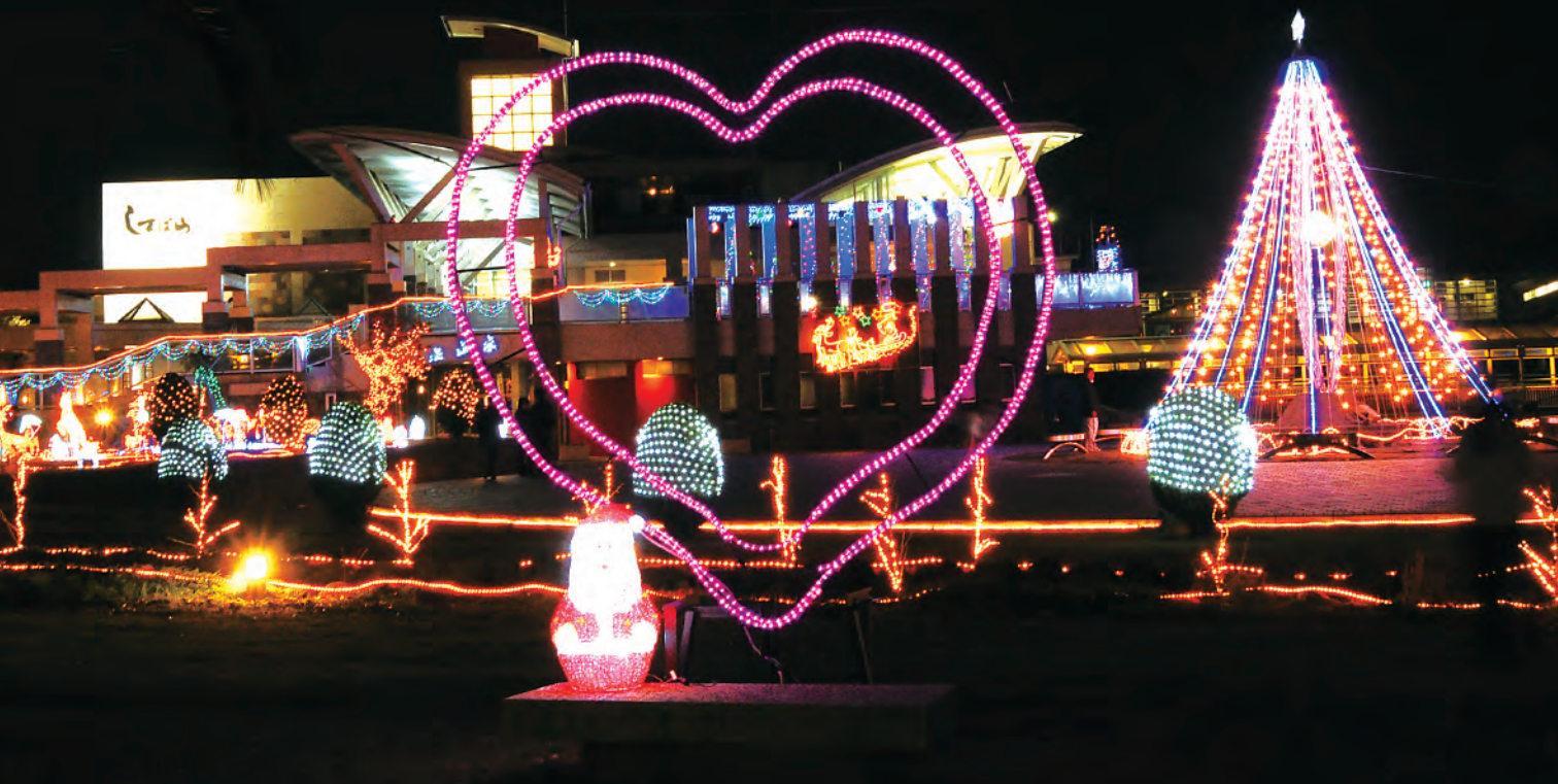
島原外港緑地公園(島原市)