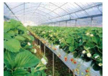
「ゆめのか」高設栽培状況