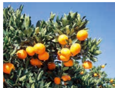
させば温州の栽培状況