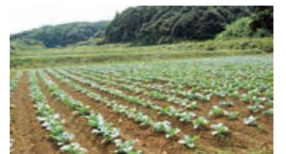
水田を活用したブロッコリー栽培状況

○水田フル活用に向けた高品質米生産、WCS用稲作付拡大、加工用たまねぎの産地化、アスパラガス・いちご・ブロッコリー・メロン・ぶどう等の安定生産販売、肉用牛の段階的な規模拡大、集約的な営農システムの構築及び農業参入法人の園芸作物の生産安定・定着に取り組み、農業・農村地域の所得向上を図ります。