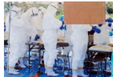
防疫作業演習状況

○市町・関係団体と連携した迅速・的確な初動防疫体制の確立を図ります。 ○飼養衛生管理基準の遵守指導を行うとともに、各種検査・調査により慢性疾病などの生産性阻害要因の除去に努めます。 ○農場におけるHACCP（危害分析・重要管理点の継続的監視・記録する工程管理システム）の考え方に基づく衛生管理手法の導入・定着推進と動物用医薬品の適正使用指導を行います。