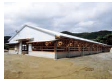
多頭飼養肥育牛舎

○新規参入者や中核農家等に必要な施設・機械等の整備、定休型ヘルパー組合や粗飼料の収集・販売を担う粗飼料流通組織の設立によって、肉用牛飼養農家の段階的規模拡大を図ります。 ○未利用地を活用した放牧技術やICT（情報通信技術）を活用し、中大規模経営体の育成を図ります。