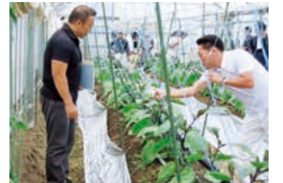
なす天敵利用防除の取組

○安全・安心な農産物生産および有機農業等を推進するために、化学肥料や農薬等の使用量を削減する技術が必要です。環境に対する負荷の少ない農業への理解および土づくりやIPM技術（総合的病害虫・雑草管理）の導入推進を図ります。