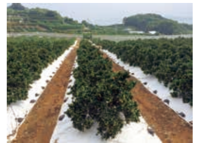
シートマルチ栽培による高品質果実の生産状況