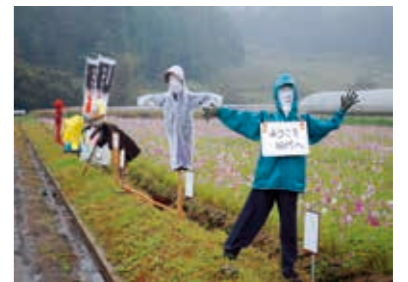
多面的機能支払制度による環境保全活動