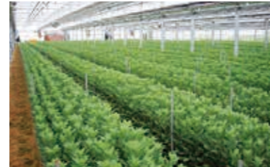
きく省力設備（自動開閉等）

○きくは、産地の出荷量を確保するために、施設や省力・省工設備導入により既存生産者の規模拡大を推進するとともに、新規栽培者の確保や栽培技術向上により早期定着を図ります。