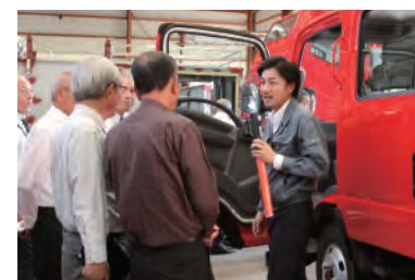
視察は顧客のニーズを知る場になっています