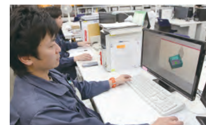
金属を効率よく削るためにシミュレーションを行います