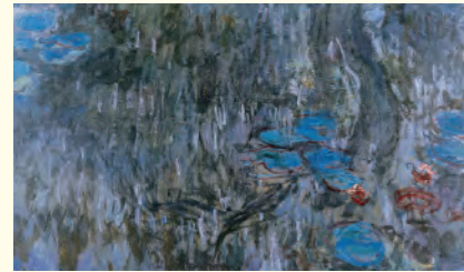
クロード・モネ《睡蓮、柳の反影》1916-19年 北九州市立美術館

モネやダリ、ウォーホル、草間彌生など、フランス印象派から現代美術までの一度は見ておきたい名画が一堂に会します。