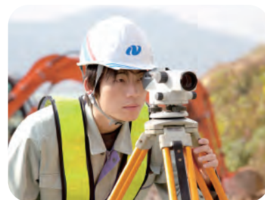
構造物が設計図どおりの高さで造られているか測量を行う