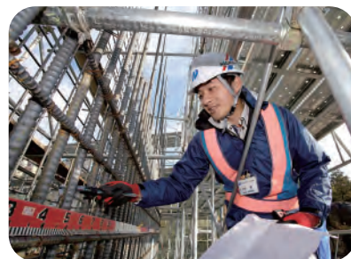
設計図どおりに鉄筋が組み立てられているかを確認する鉄筋検査を行う

道路の建設や拡幅、改良工事の際、工事現場で監督や測量などを行うほか、百花台公園の整備なども行っています。将来は道路の建設や大規模な改良工事を担当し、地域の活性化に貢献したいです