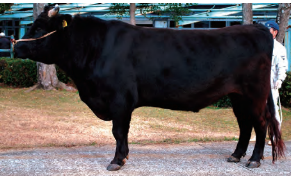
肉質・肉量に優れた県有種雄牛「金太郎3」号

また、5年に一度開催され、「和牛のオリンピック」とも言われる全国和牛能力共進会では、平成24年第10回長崎大会「肉牛の部」での日本一に続き、今年9月の第11回宮城大会でも第7区(総合評価群)の肉牛部門で特別賞に輝くなど、長崎和牛の品質は、全国的に高く評価されています。