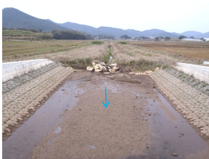
農道橋より上流を望む