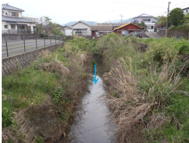
柳川橋より上流を望む