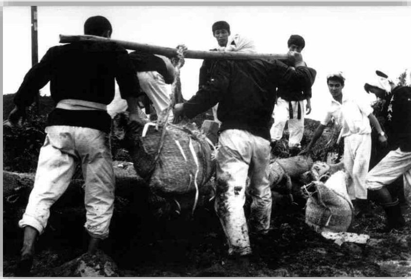
力を合わせて土のうで 復旧する人々