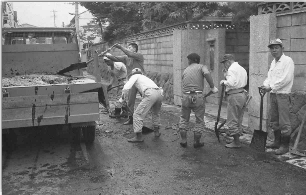
道路清掃に長靴が手放せません