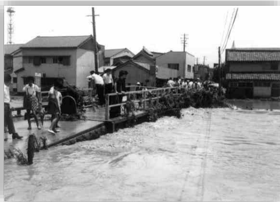
被害状況を見つめる人たち