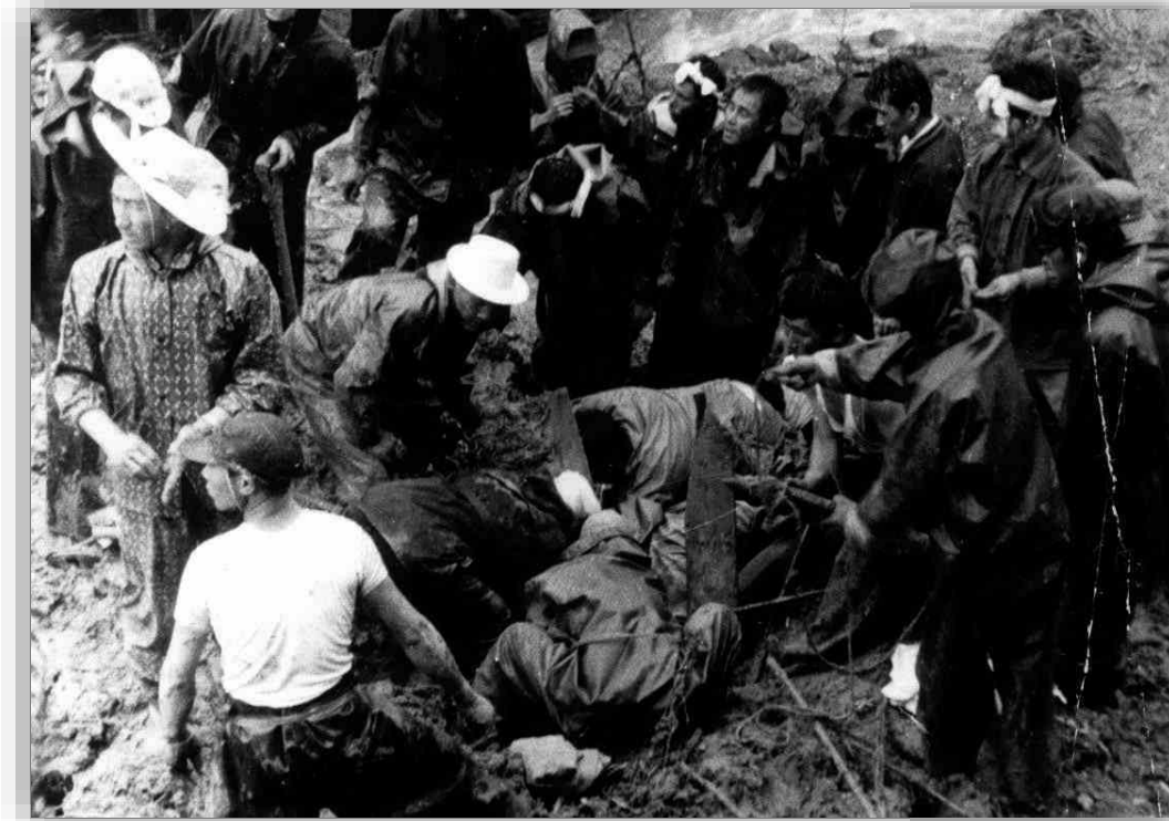
土砂災害からの懸命な救助作業