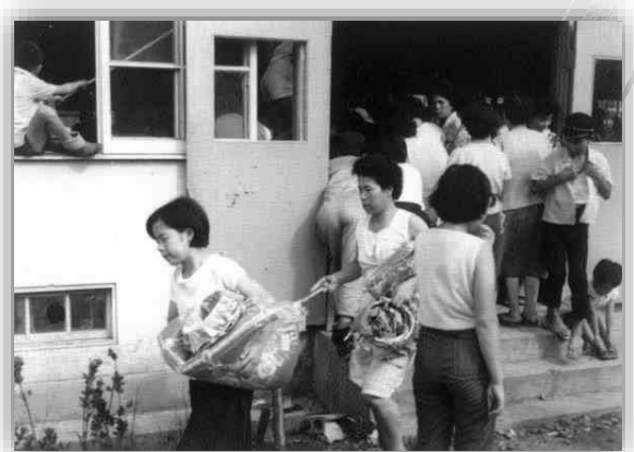
被災者に配布される救援物資