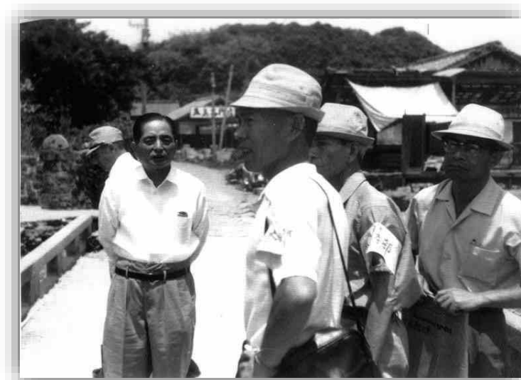
現地視察する 長崎県知事 佐藤勝也