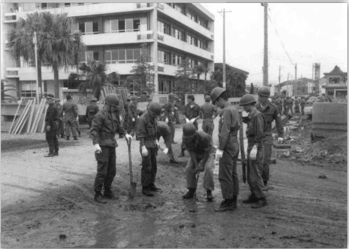
スコップの先が見えなくなる程たまった土砂