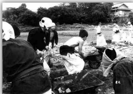
若い復旧作業員たち