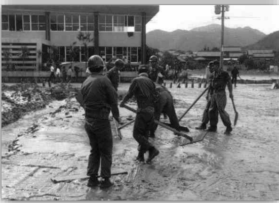
多くの自衛隊員により泥のかき出しを行いました