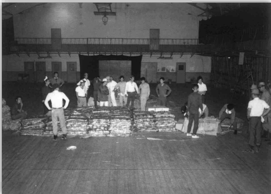
各方面から届いた救援物資