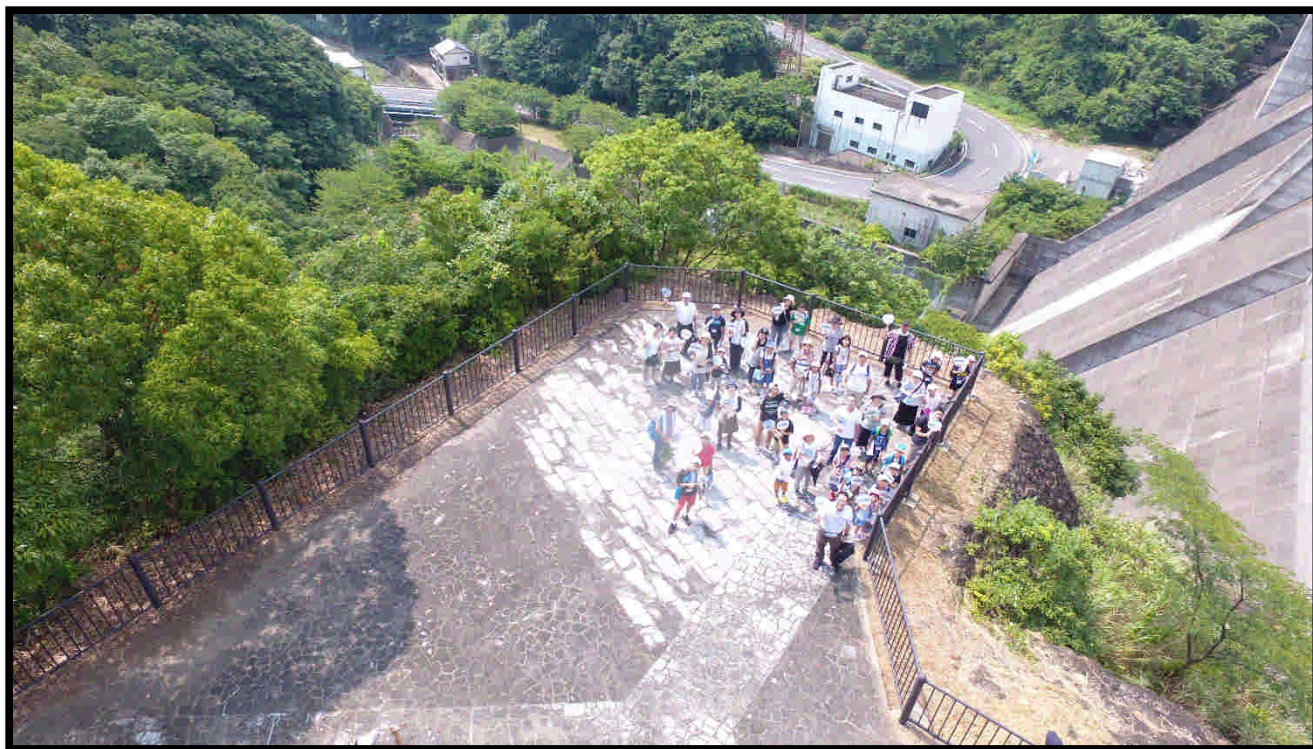
中尾ダムにてドローンで記念撮影