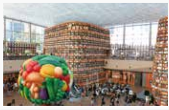
昨年オープンした星の庭図書館

ソウル市江南区に位置する「COEX」。地下のショッピングモールには、おしゃれなレストランをはじめ、約5万冊の蔵書を無料で閲覧できる「星の庭図書館」などがあります。また、「SMTOWN」では、K-POPアーティストのホログラムシアター鑑賞なども楽しめます。COEXで最新の韓国体験をしてみませんか。