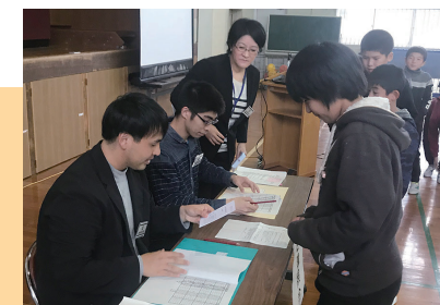
時津北小学校での模擬選挙

小・中・高等学校において、実際の選挙に用いる投票箱などを使って投票を体験してもらい、選挙について楽しみながら学んでもらう「模擬選挙」の運営をサポートします。将来の有権者を育てるため、分かりやすく選挙の大切さを呼びかけています。