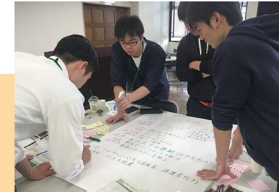
ミーティングの様子

サポーターが集まり、若者の政治に対する関心が低い理由を考えます。どうすれば若者が投票に参加するか、大学生や社会人などの立場から分析し、意見交換や発表を行うなどして、理解を深めています。