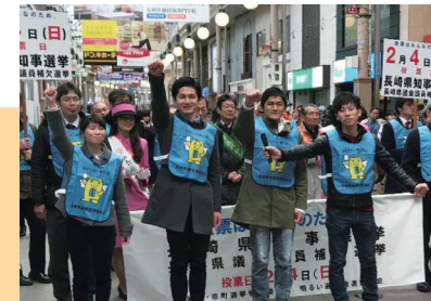
浜の町アーケード(長崎市)での街頭啓発

県が行う啓発事業に参加し、直接有権者へ投票参加を呼びかけます。また、選挙が行われる時以外でも、若者の投票率向上のため大学構内での広報活動を行っています。