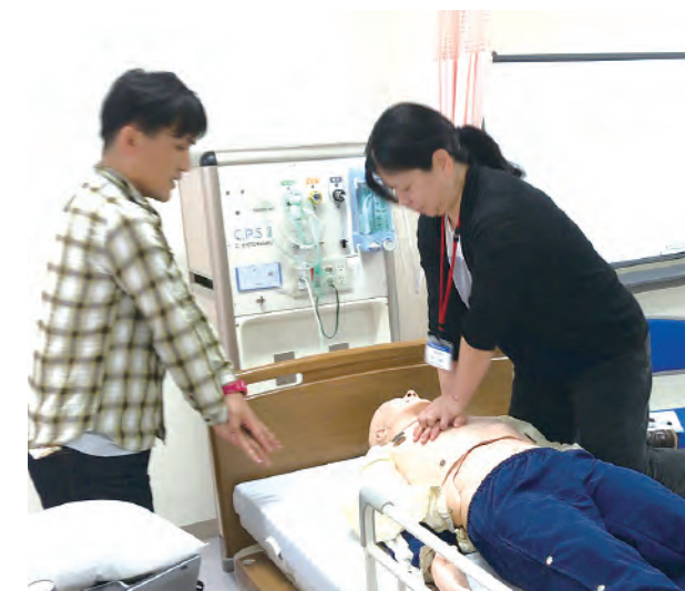
復職を目指す方を対象にした看護技術研修