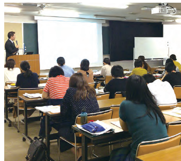
新人看護師の集合研修

長崎県看護キャリア支援センターでは、結婚や出産により離職していた看護職員が、安心して現場へ復帰できるよう復職や就業相談に乗っています(無料)。また、シミュレーターを使った注射技術研修をはじめとする看護技術研修も行っています。