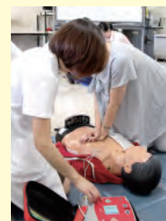
出産や育児等によって休職・離職中の医師を対象にしたトレーニング