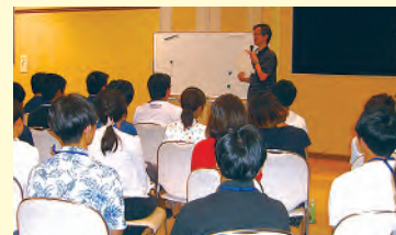
離島で学ぶ夏季ワークショップ