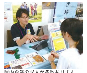
県内企業の求人が多数あります

※県の大阪事務所では、テレビ電話で長崎本部の相談員に移住相談ができます(事前予約が必要)