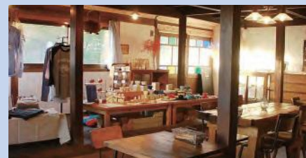
本事業を活用してオープンしたショップ・カフェ「te to ba(手と場)」(五島市)