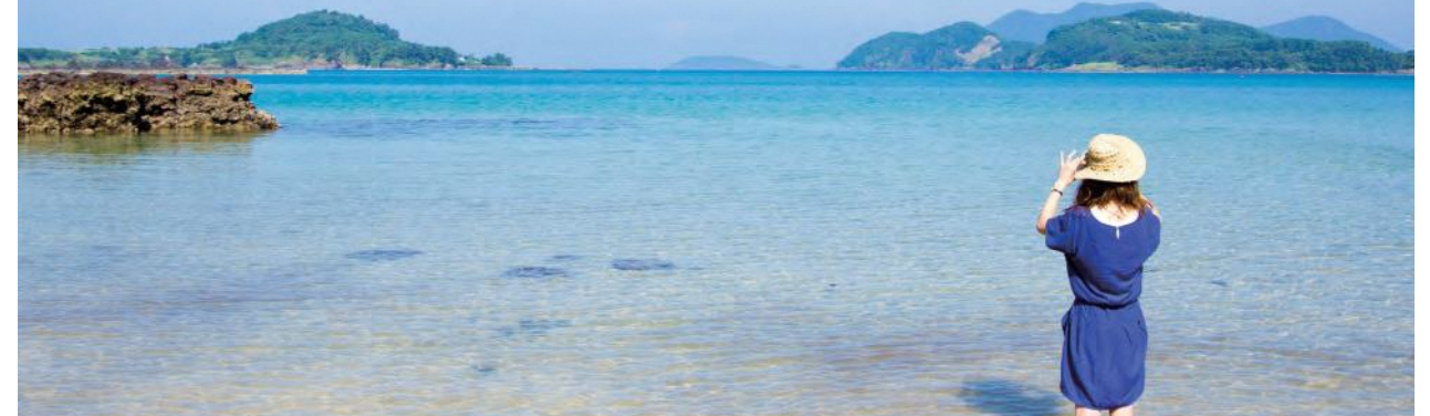
柿の浜海水浴場(小値賀町)

美しい自然に囲まれ、海の幸・山の幸に恵まれた長崎県は、都市部と比べて生活コストが安く、暮らしやすいことも魅力で、昨年度は、県外から1,121名のU・Iターン者が県内各地に移り住みました。県では、市町と連携し、移住の検討段階から地域への定住まできめ細やかなサポートを行うのはもちろんのこと、地域の雇用創出にもつながる事業拡充や創業などを支援することで、U・Iターン者が安心して定住できる環境づくりを進めています。