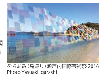
そらあみ(島巡り) 瀬戸内国際芸術祭 2016

参加者と共に編んだ漁網を空に掲げ、網の目を通して土地の風景を捉え直すアートプロジェクトです。