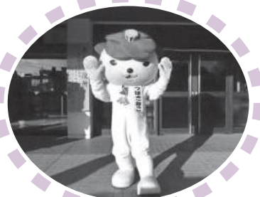
五島イメージキャラクター つばきねこ