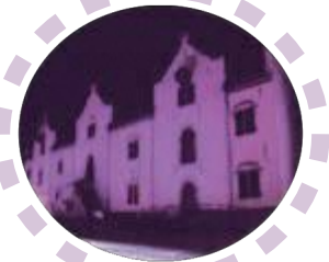
オランダ商館 (平戸市) H30年度実施

より多くの方にメッセージを届けられるよう、色々な場所でパープルライトアップをしていただくことを目指しています。