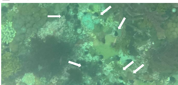
図5 確認されたウニ（ウニ：矢印）