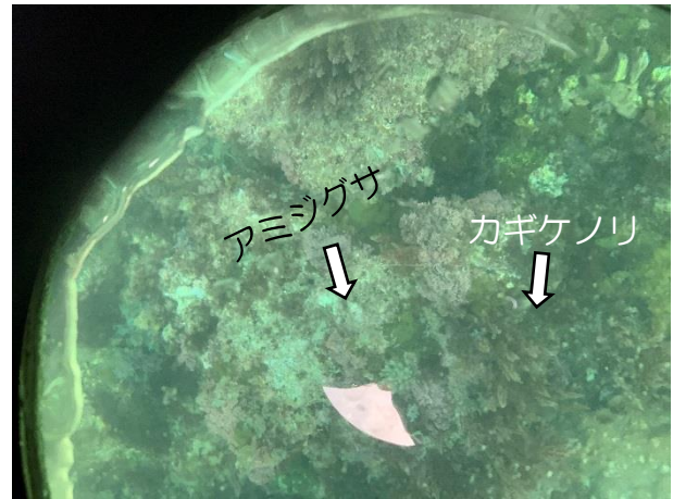
図2 カギケノリやアミシグサなど