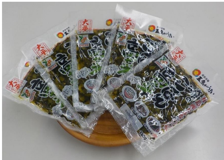
五島産100パーセントの高菜加工品