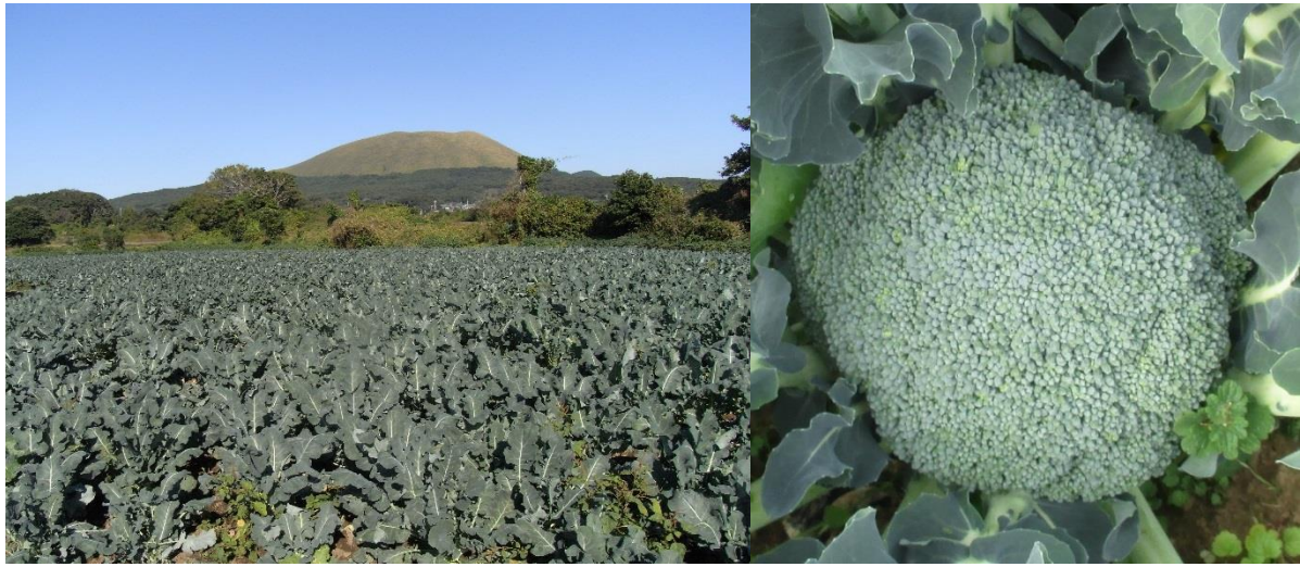
五島全域で栽培されるブロッコリー